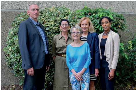
L'équipe de direction, pilote de l'entreprise