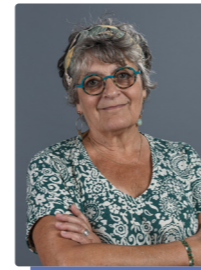
SADY Catherine ST PIERRE EN AUGÉ (14)