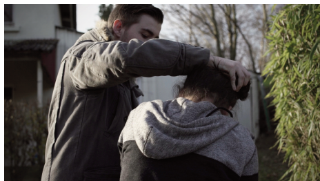
Saynète 6 : «Sur le chemin du retour»