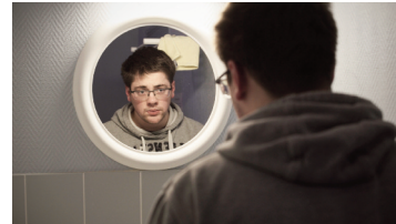
Saynète 3 : « J'en peux plus ! »