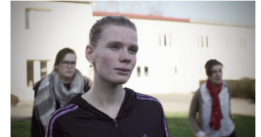
Saynète 2 : « Lâchez-moi ! »