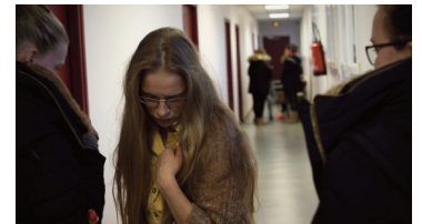
Saynète 4 : « Comment t'es sapée ? »