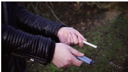
Saynète 7 : «Clope ou pas clope ?»