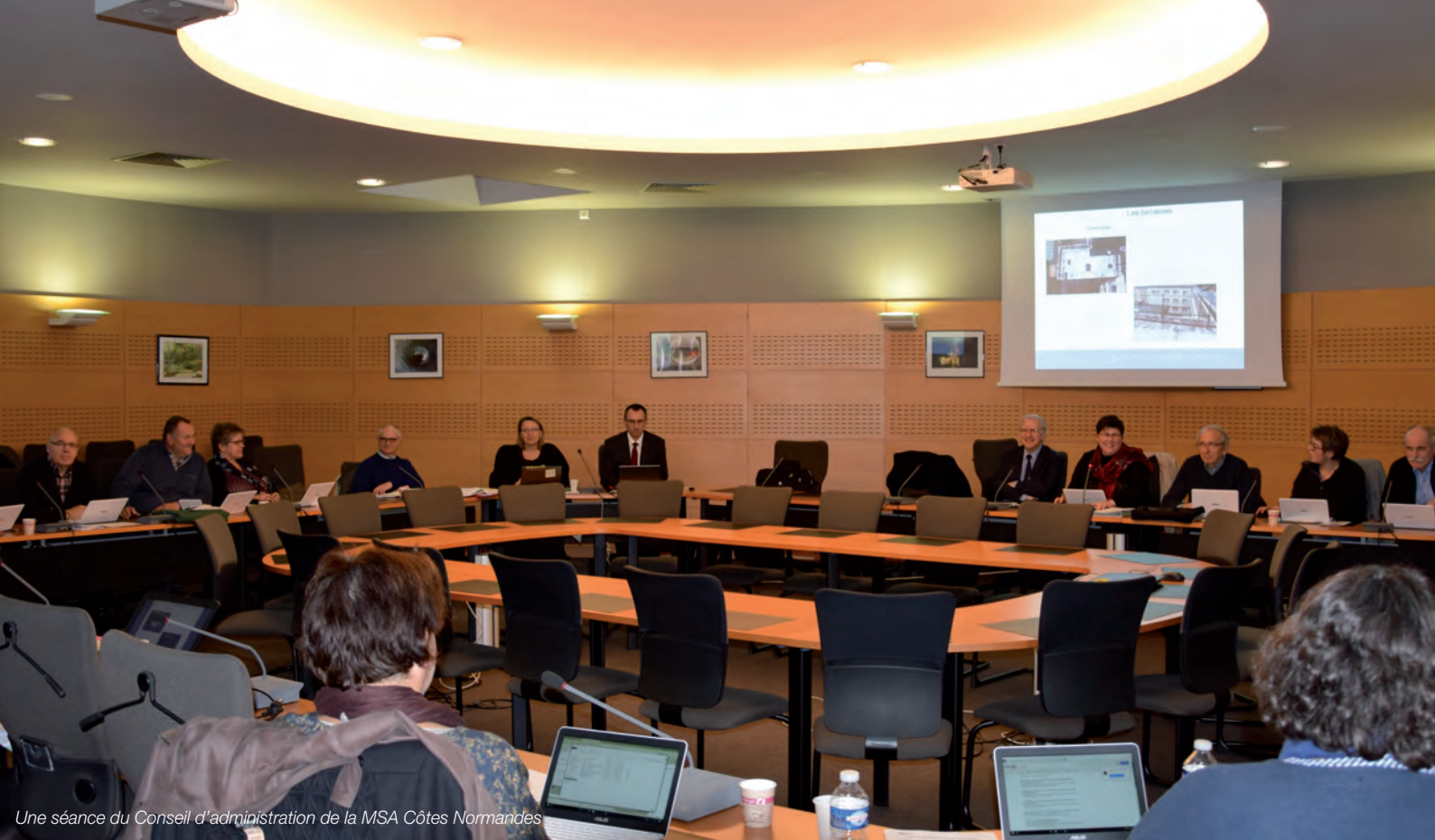
Une séance du Conseil d'administration de la MSA Côtes Normandes